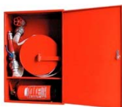
KSZ2-Ca falon kívüli, alsó elosztású/ out of the wall with lower located case