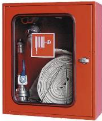
V2-Cüko falon kívüli, kisüveges/ out of the wall, steel door with small glass