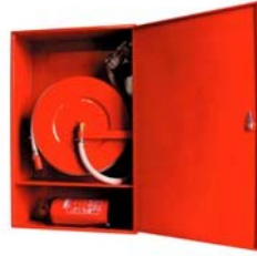
Kombinált tűzcsapszékény KSZ-D2a Falon kívüli / out of the wall