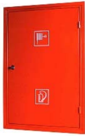
Kombinált tűzcsapszékény KSZ-D1a falba süllyeszthető / sinkable in the wall