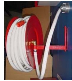
Alaktartóömlő bemutatón „D” típus

Ha nem érti, vagy nem tudja, vegye igénybe Építész Tűzvédelmi Szakértőnket.