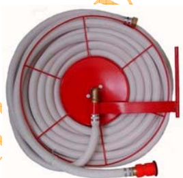
Küllös dob on alaktartó tömlő