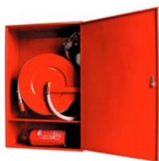
Kombinált tűzcsapszekrény KSZ-D2am falon kívüli / Combined fire hose cabinets, out of the wall