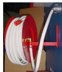
Alaktartótömlő bemutatón „D” típus

Ha nem érti, vagy nem tudja, vegye igénybe Építész Tűzvédelmi Szakértőnket.