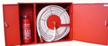
Kombinált tűzcsapszekrény, KSZ-D2m falon kívüli / Combined fire hose cabinets, out of the wall