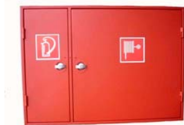
Kombinált tűzcsapszekrény KSZ-D1m falba süllyeszthető / Combined fire hose cabinets, sinkable in the wall