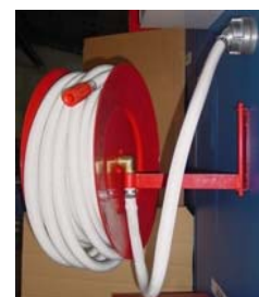
Alaktartótömlő bemutatón „D” típus

Ha nem érti, vagy nem tudja, vegye igénybe Építész Tűzvédelmi Szakértőinket.